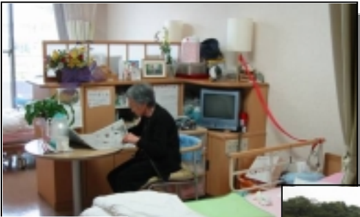
エクセルライフ 居室風景