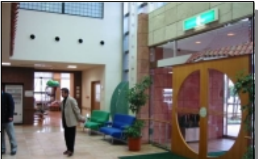
マイ・グリーンヒル 玄関ホール